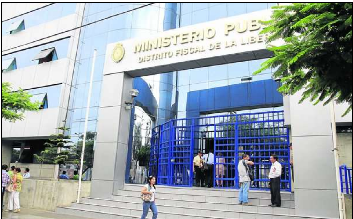
Av. Jesús de Nazareth 462, Trujillo 13011