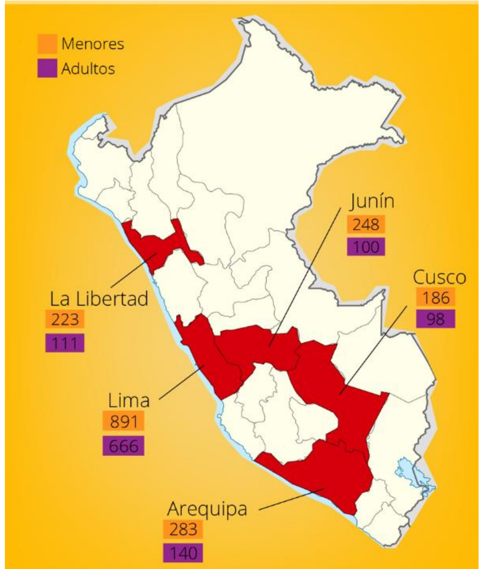
GRÁFICO N° 01: Departamento con más casos de Violación Sexual