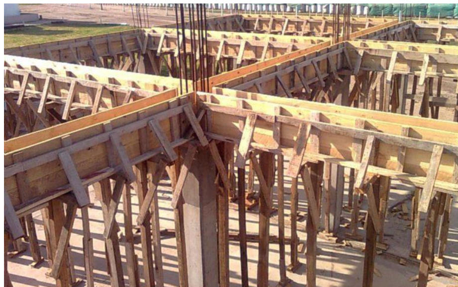
Figura 2: Encofrado tradicional.

Aunque se puede utilizar para diferentes tipos de obra, se recomienda para aquellas que son de pequeña o mediana envergadura. También es necesaria la aplicación de hormigoneras para garantizar la correcta dosificación del concreto y el fraguado en el encofrado sea el óptimo.