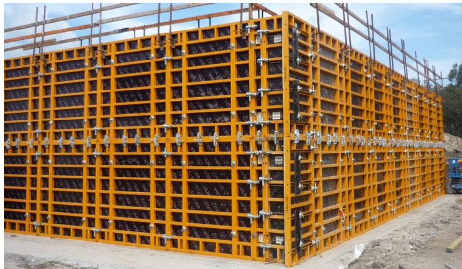
Figura 1: Encofrado modular.

Puede ser un trabajo casero pequeño que requiera de gran resistencia al concreto vaciado.